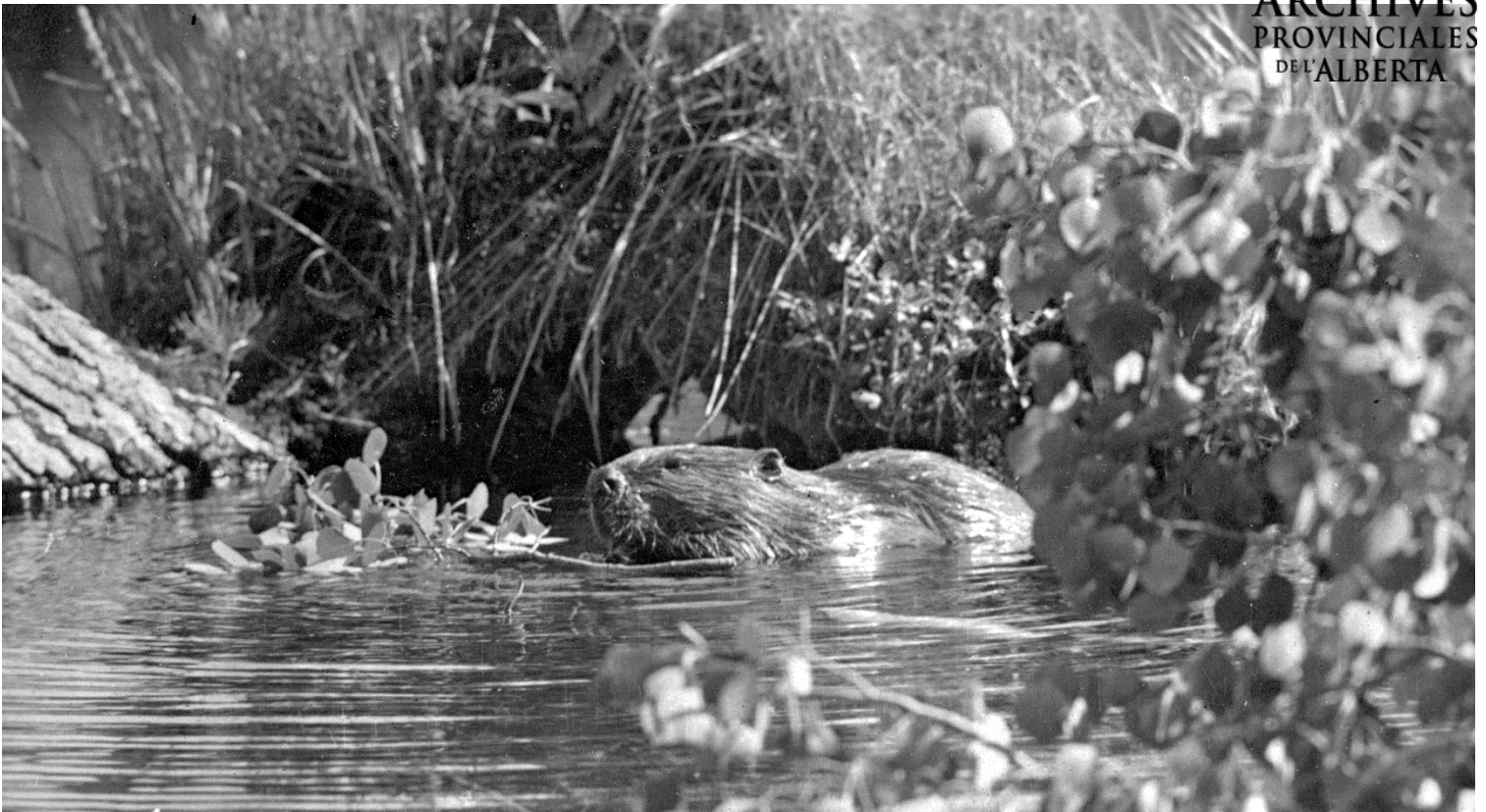
Figure 1 – Castor dans l'eau, les années 1920 (APA, A15788)