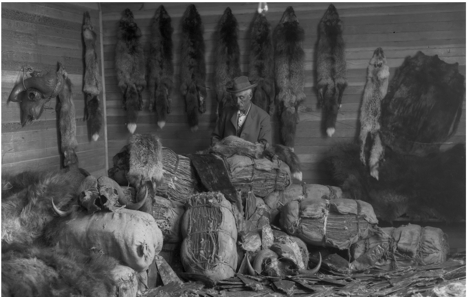
Figure 8 - Tri de fourrures de renard noir, vers 1900 (APA, B10018)