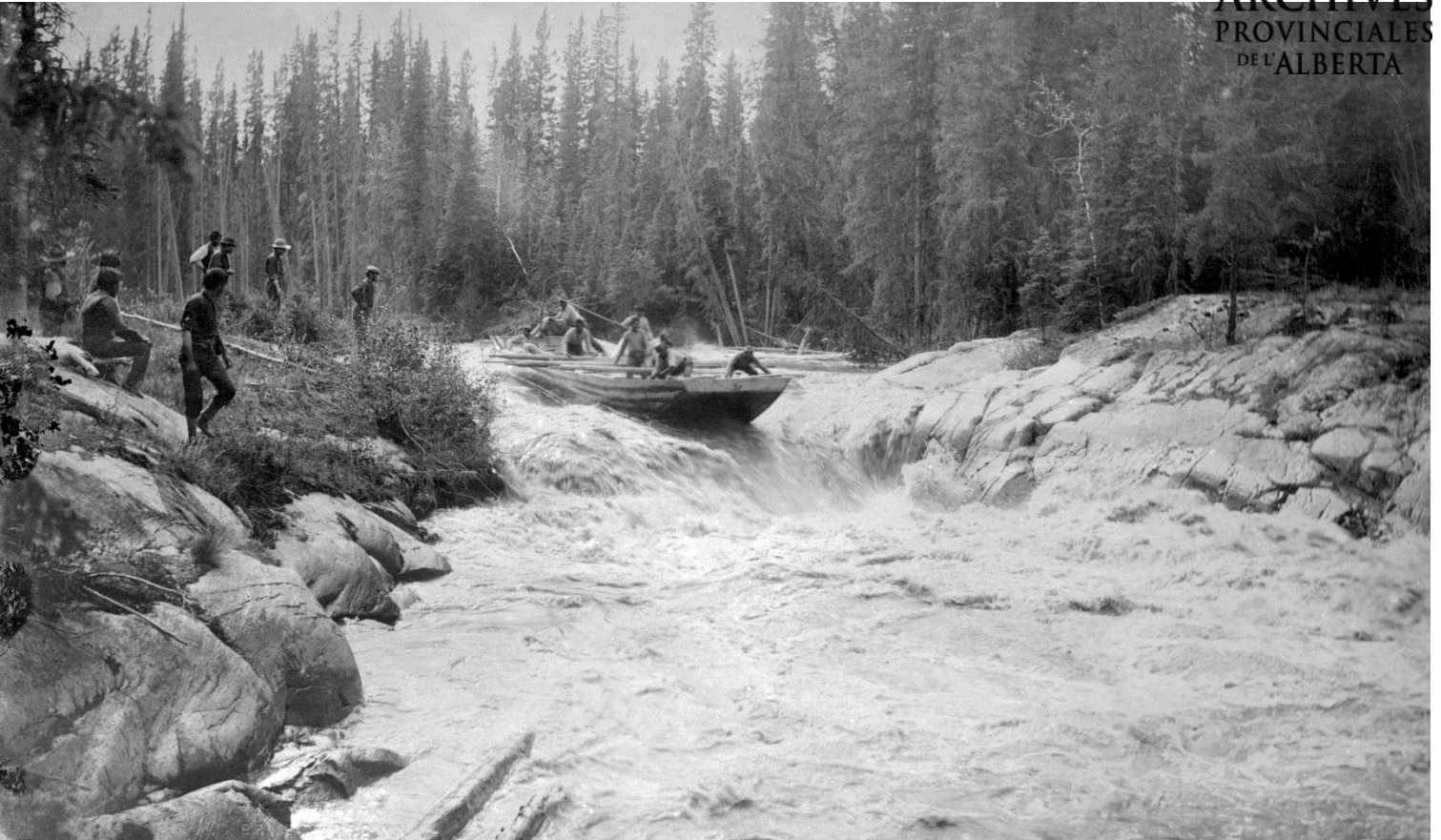
Figure 3 - Bateau de commerçants sur les rapides du Slave River, les années 1900