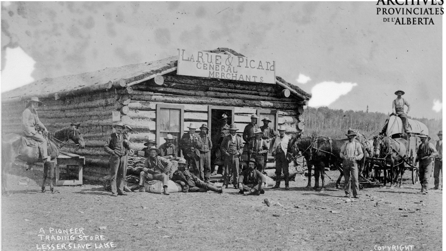
Figure 5 - Magasin général et poste de commerce LaRue et Picard, vers 1890, à Lesser Slave Lake