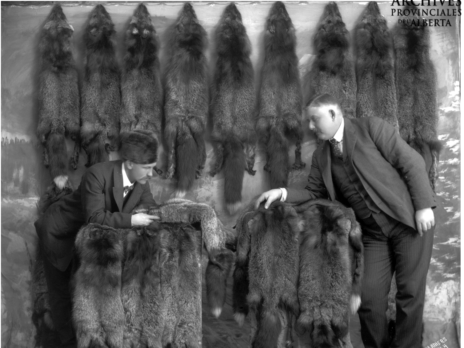
Figure 9 - Fourrures de renard argenté, Lesser Slave Lake, 1904