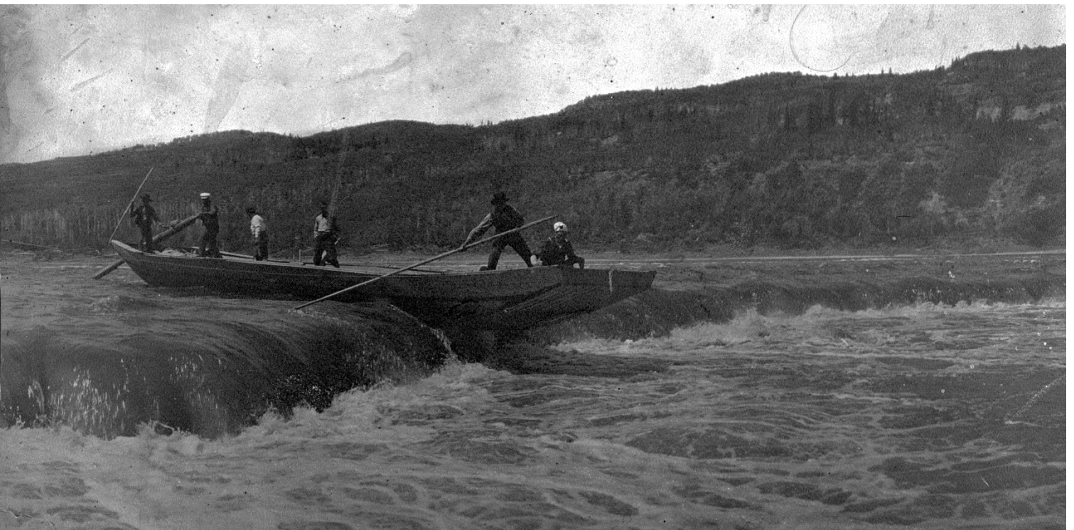
Figure 4 - Bateau sur les rapides du Slave River, probablement aux chutes Vermilion, les années 1900 (APA, A7210)