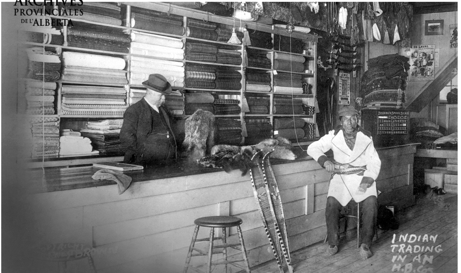
Figure 7 - Autochtone échangeant des fourrures dans un magasin de la Compagnie de la Baie d'Hudson, les années 1900