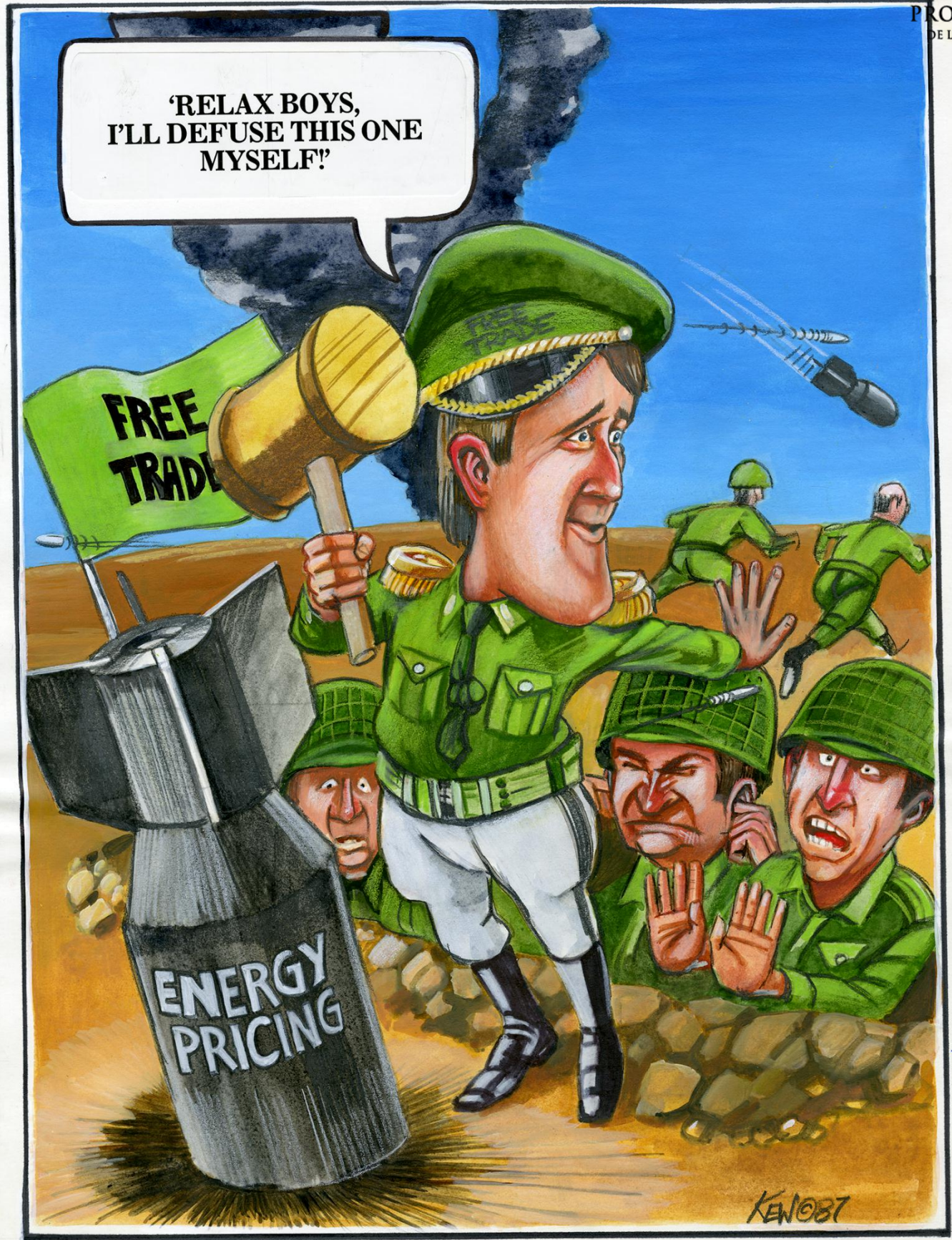
Figure 1 - Caricature de Kew, Edmonton Sun, 1987