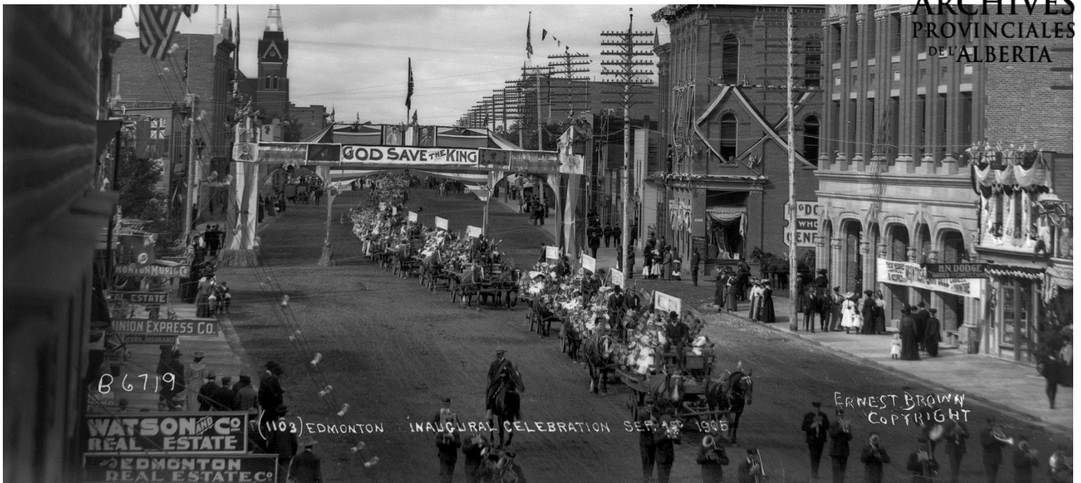
Figure 3 – Défilé à l'inauguration de la province