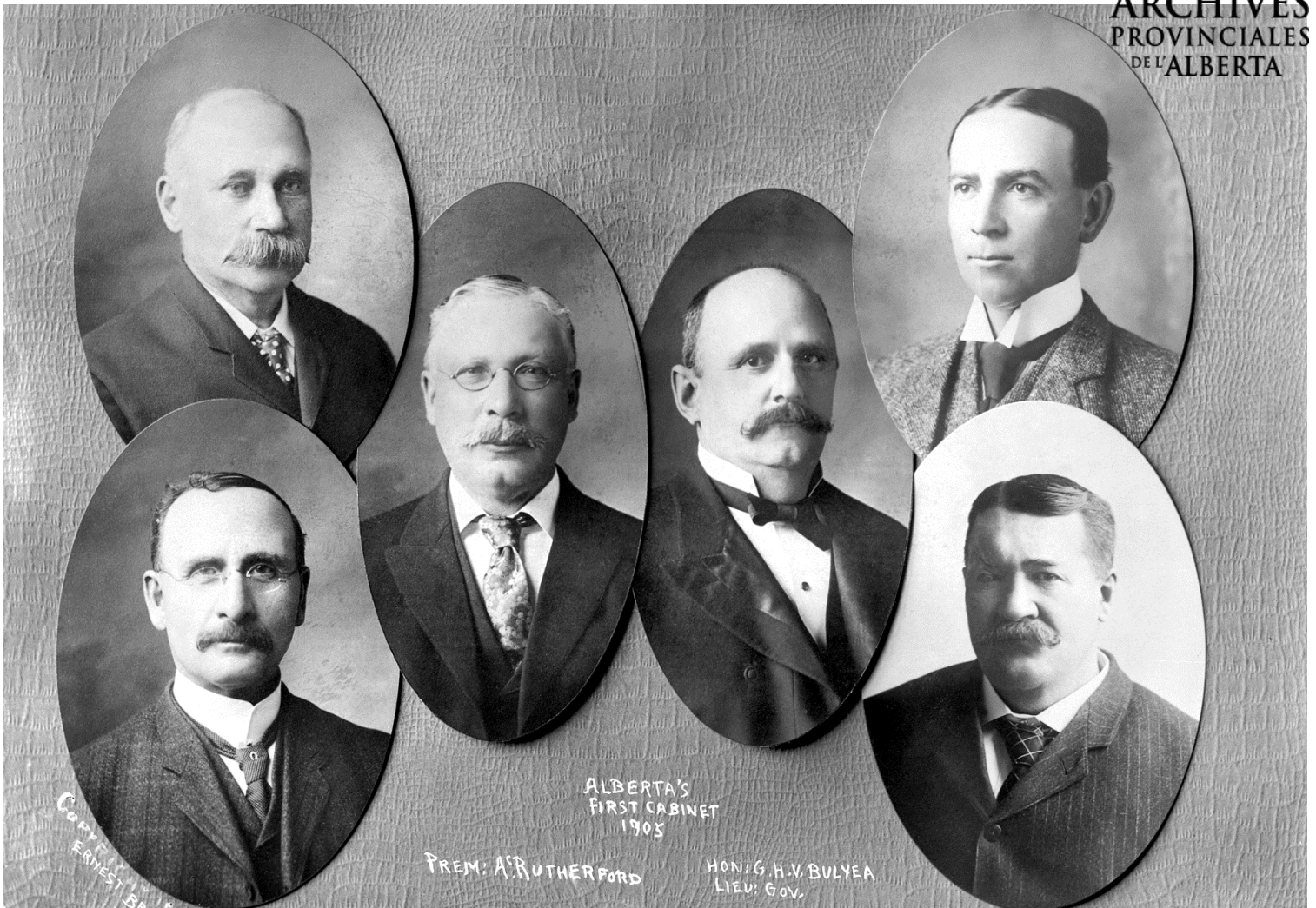
Figure 5 – Membres du premier cabinet de l'Alberta: William Thomas Finlay, Ministre de l'agriculture, William Cushing, Ministre des travaux publics, Premier ministre Alexander Rutherford, Charles Cross, Procureur général, Leverett DeVeber, sans portefeuille