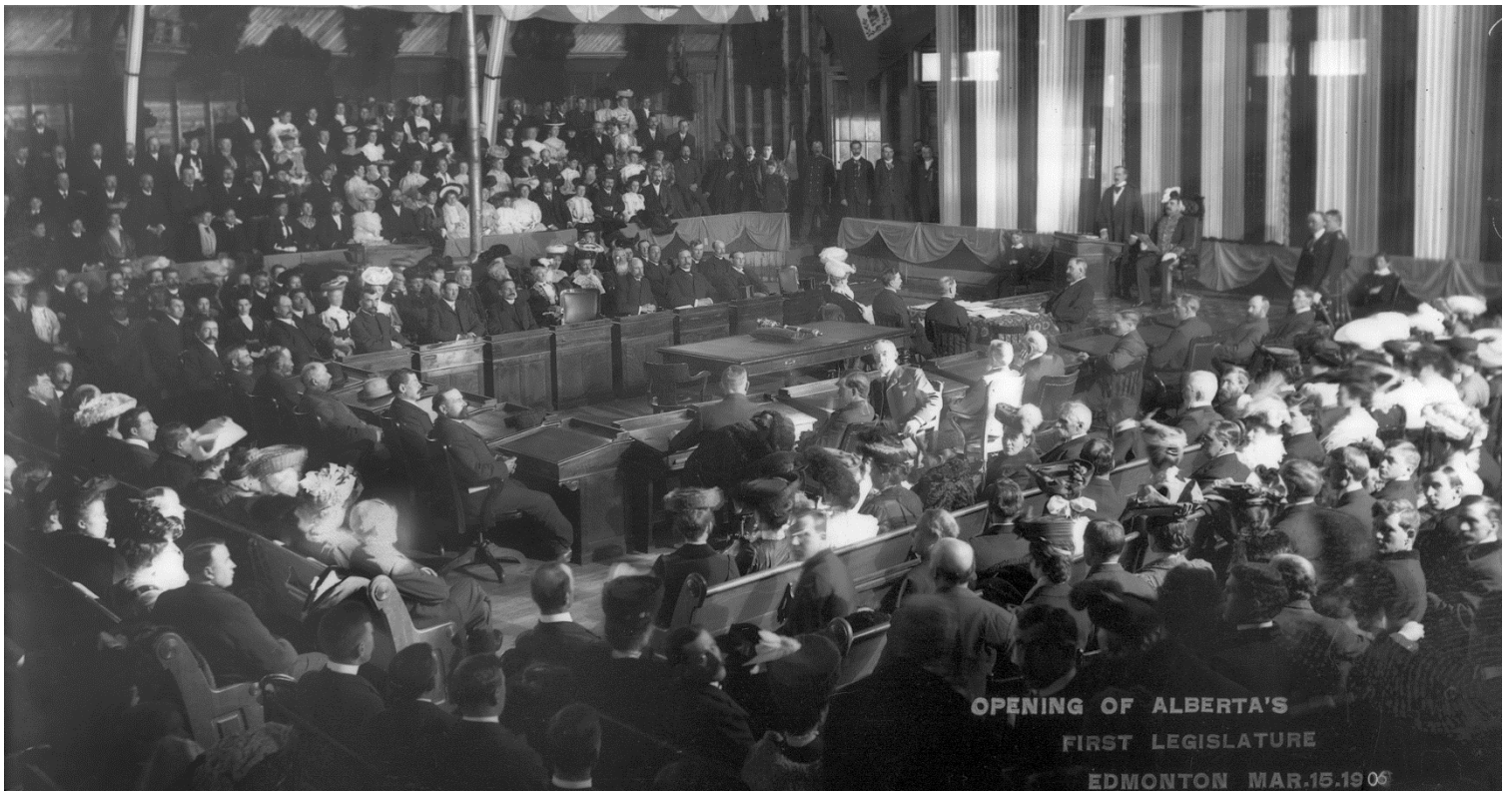
Figure 6 - Ouverture de la première Assemblée législative, 15 mars 1906