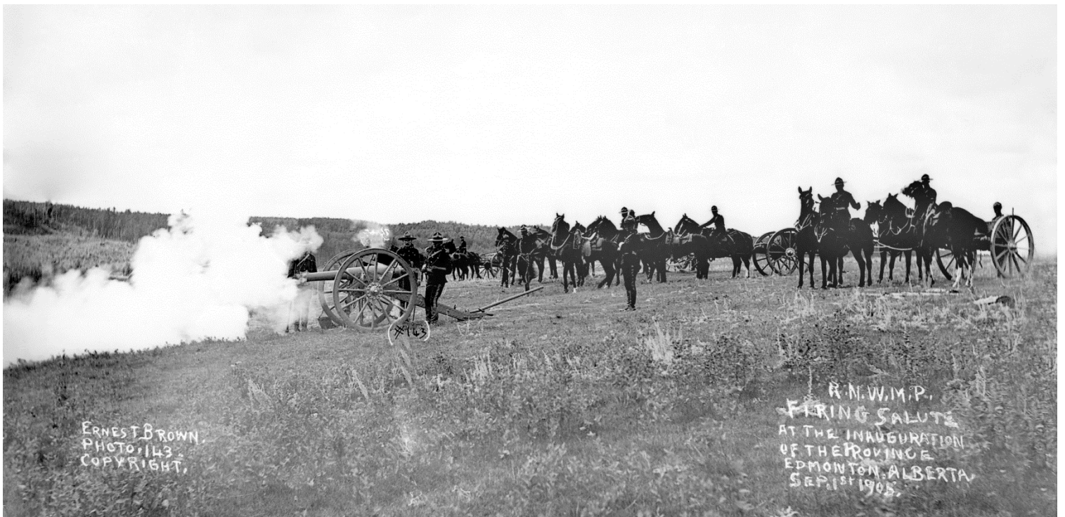
Figure 2 - Salve d'honneur de la Police montée, à l'inauguration de la province (APA, B6672)