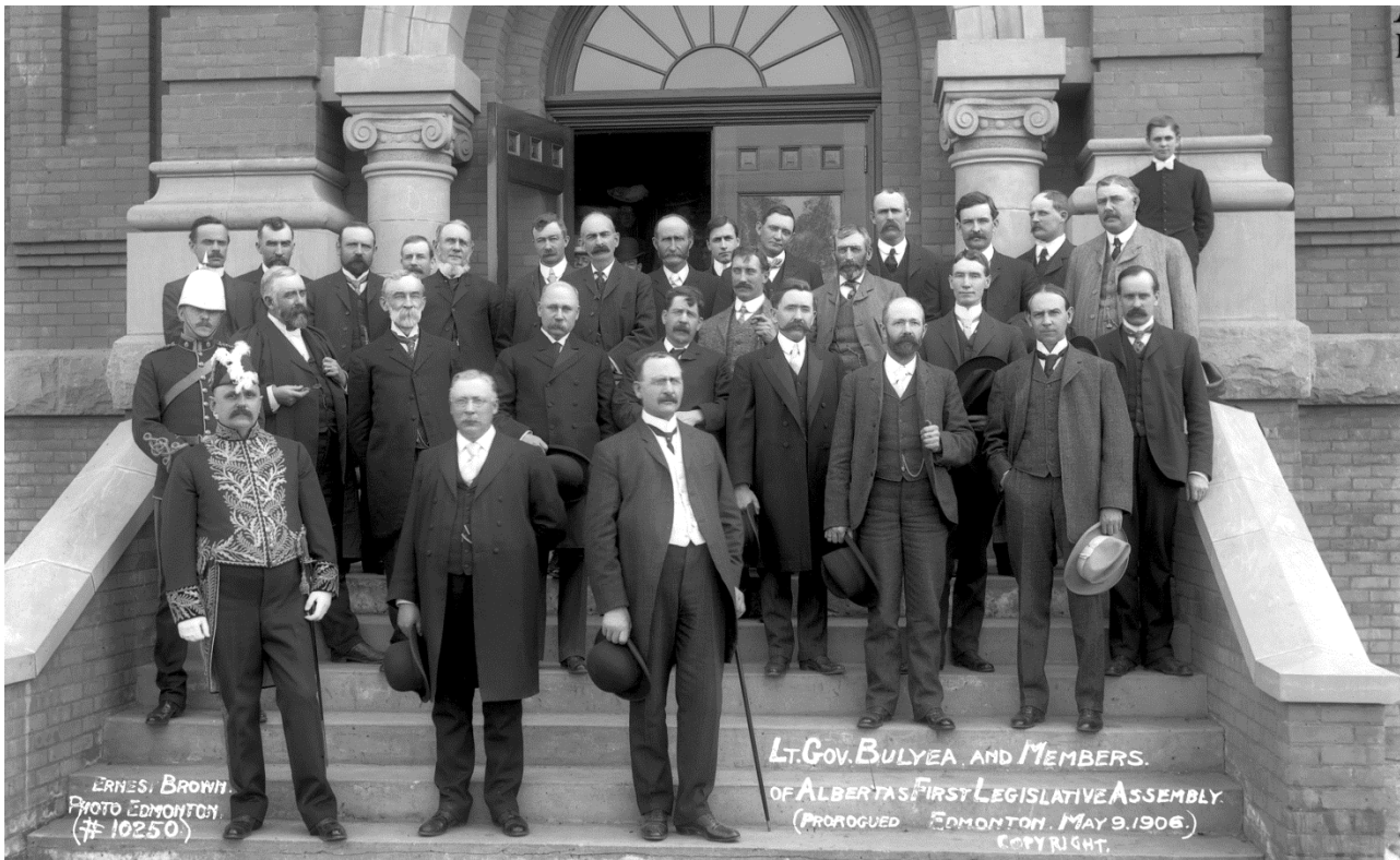
Figure 7 - Lieutenant-gouverneur Bulyea et membres de la première Assemblée législative de l'Alberta, mai 1906 (APA, B6632)