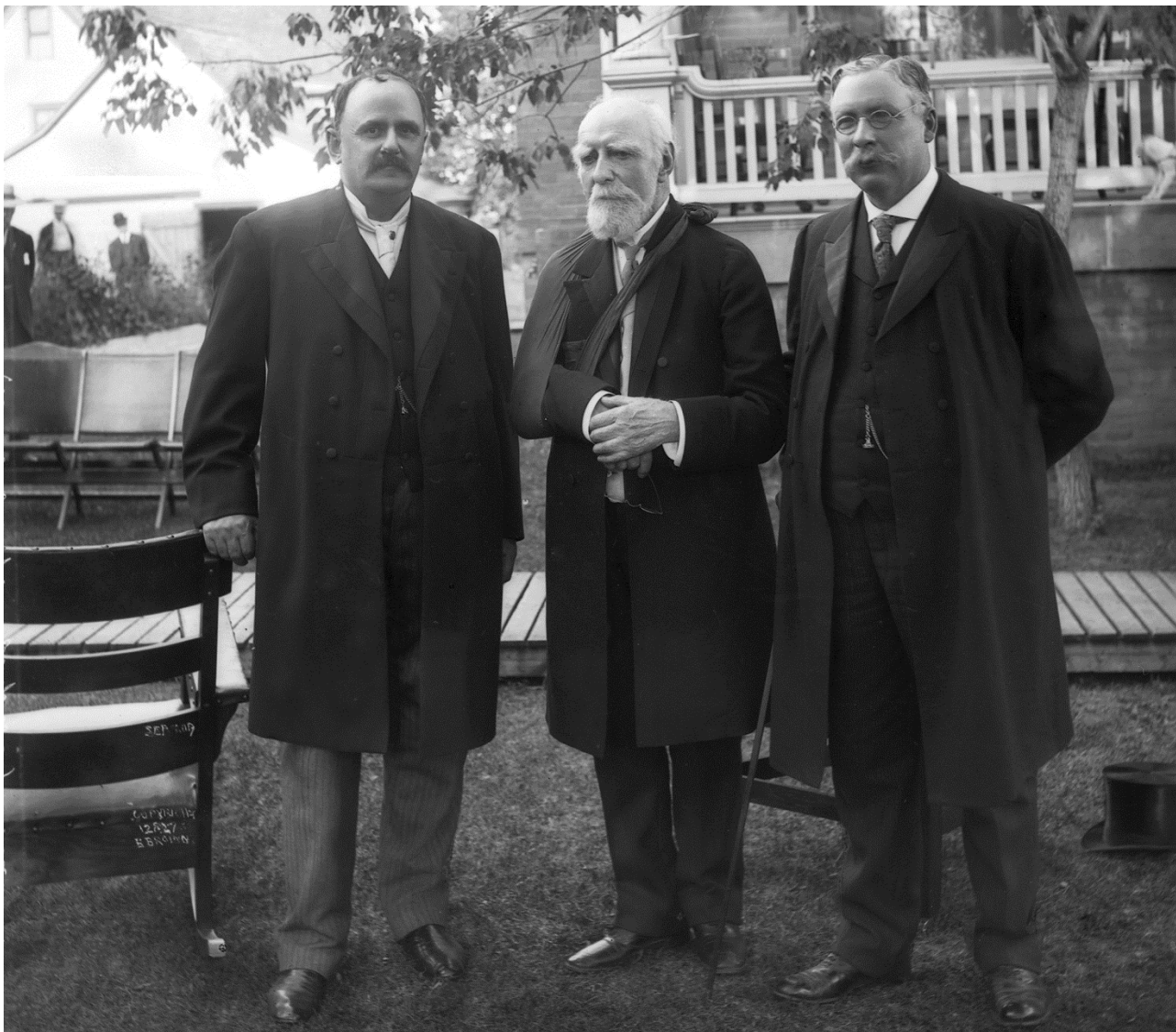
Figure 8 - Lieutenant-gouverneur Bulyea, Lord Strachona et le Premier ministre Rutherford