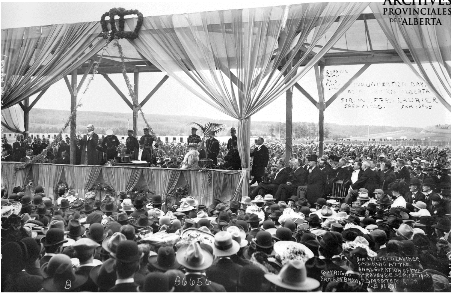
Figure 1 - Sir Wilfred Laurier, Premier ministre du Canada, tient un discours à l'inauguration de la province de l'Alberta, 1 er septembre 1905