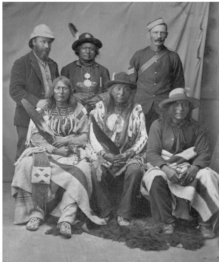
Figure 10 – Portrait de groupe : John Le Heureux, Red Crow, Sgt. Percy, Crowfoot, Eagle Tail et Three Bulls en route vers Ottawa, 1886