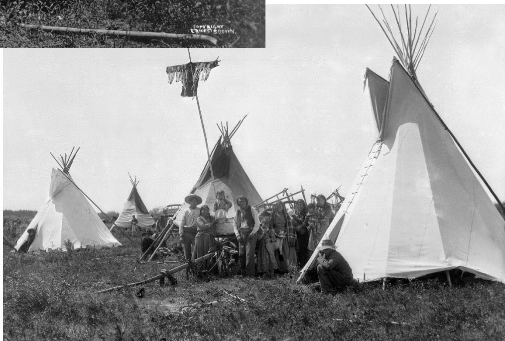
Figure 2 – Membres des Premières nations à la maison [env. 1891-1904]