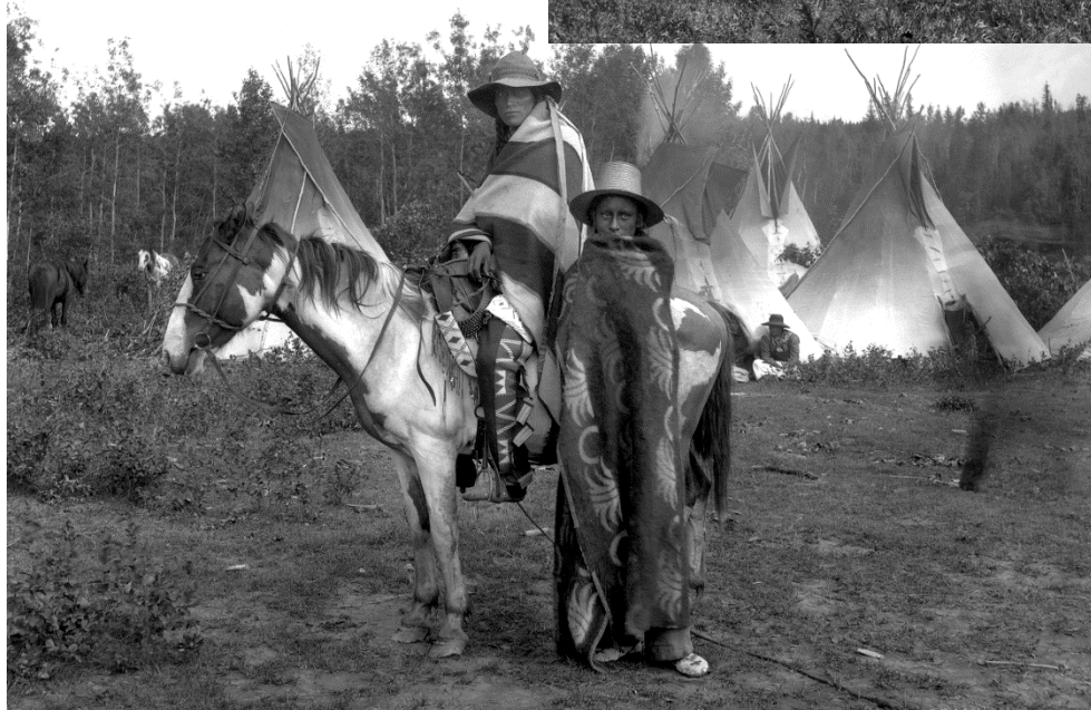
Figure 3 - Autochtones Cris [env. 1891-1904]