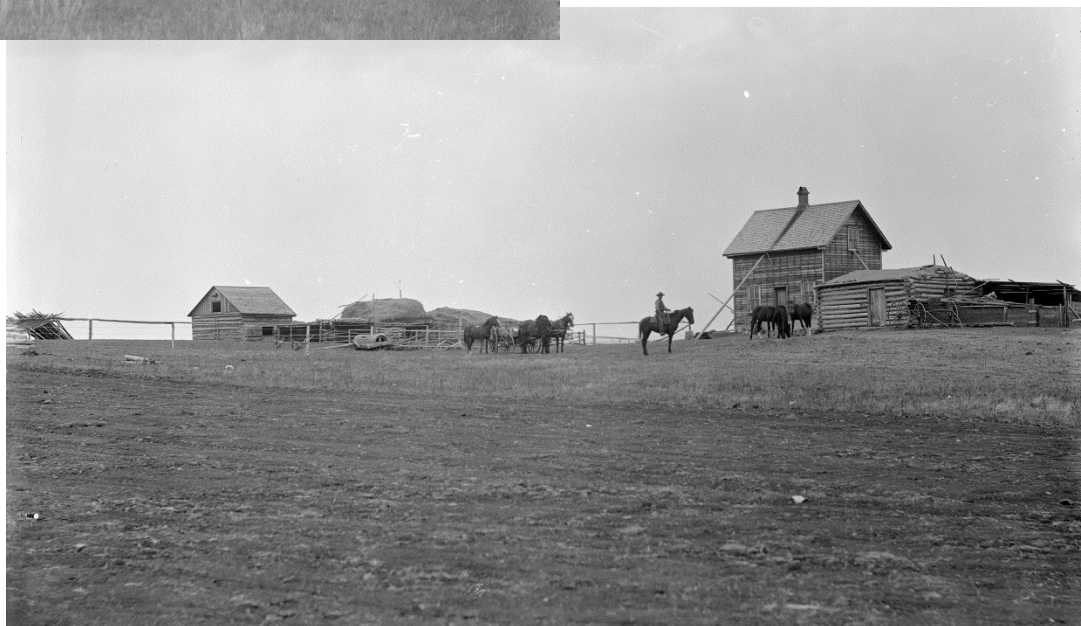
Figure 12 – Ferme près de Calgary, 1883 (APA, B119)