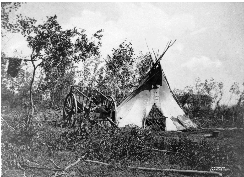
Figure 1 - Maison des Premières nations, la tente [env. 1891-1904]