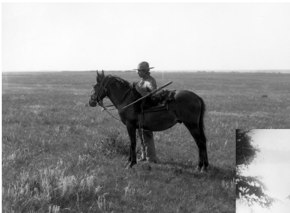
Figure 4 - Homme appartenant aux Premières nations sur les plaines, vers 1885 (APA, B16)