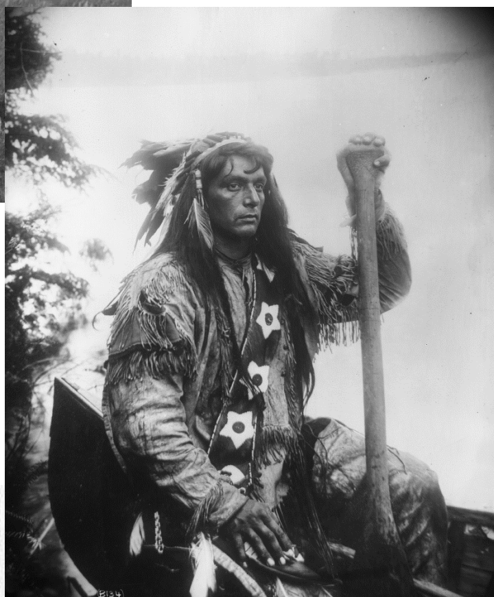
Figure 5 - Hiawatha, Iroquois, les années 1890 (APA, B19)