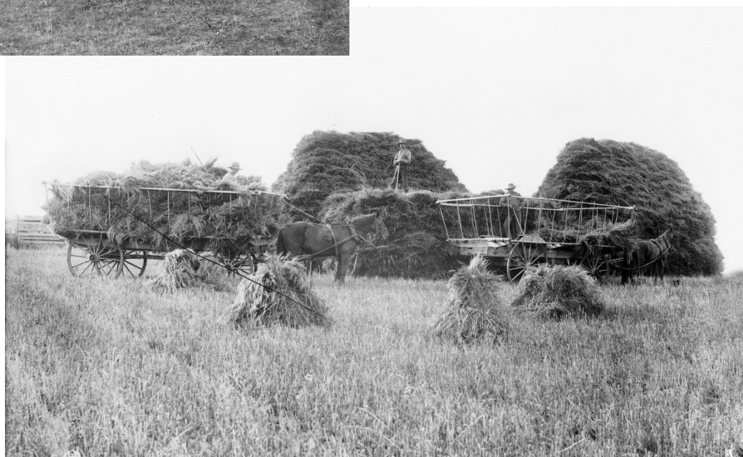
Figure 14 - Récolte près d'Edmonton, les années 1900 (APA, B164)