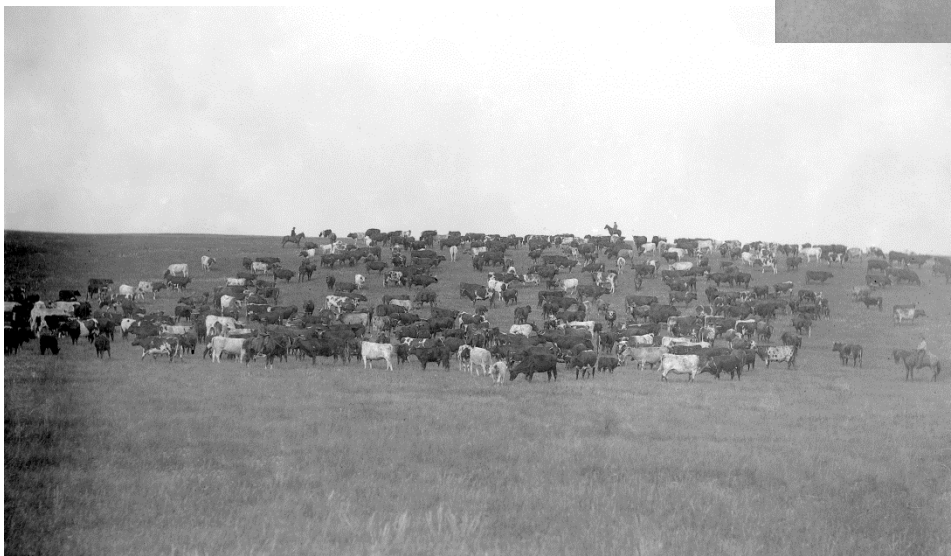
Figure 11 – Élevage en Alberta, 1883 (APA, B113)