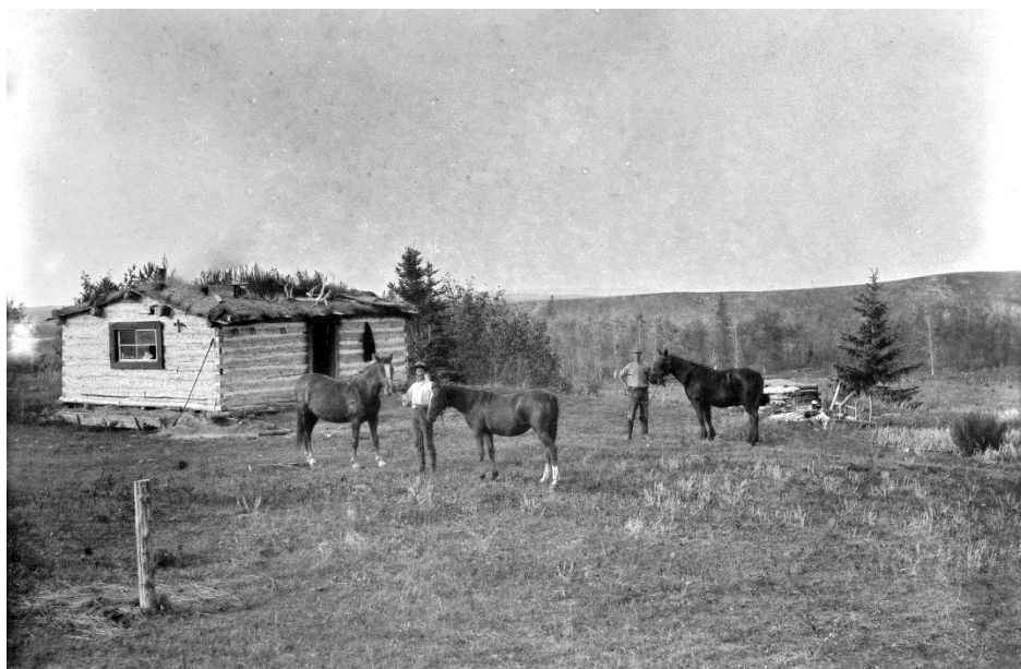
Figure 13 - Cabane en bois près de Calgary, les années 1890