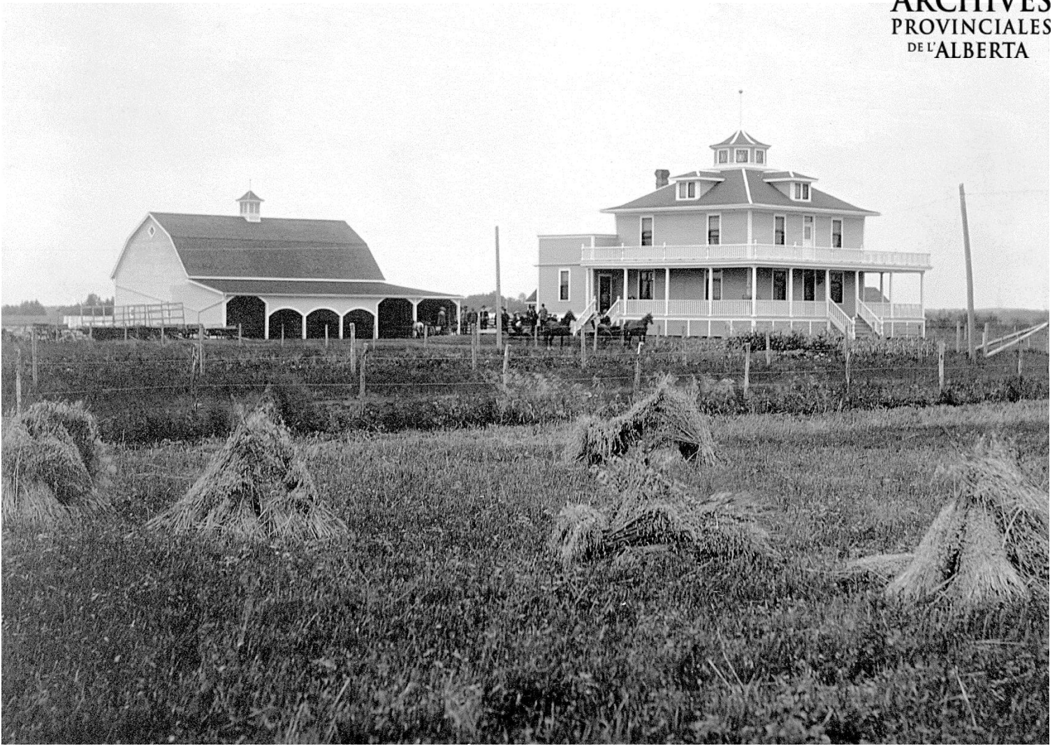
Figure 7 - Maison et ferme de Pierre Bérubé à Beaumont (APA, A8707)