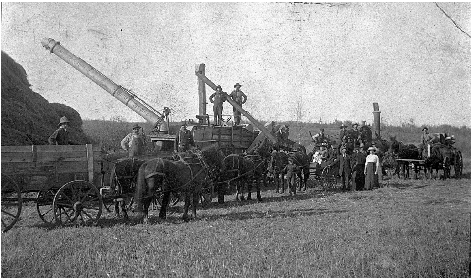
Figure 6 - Les équipes de battage de Villeneuve, Royer et Leviens à Beaumont, les années 1920 (APA, A8704)