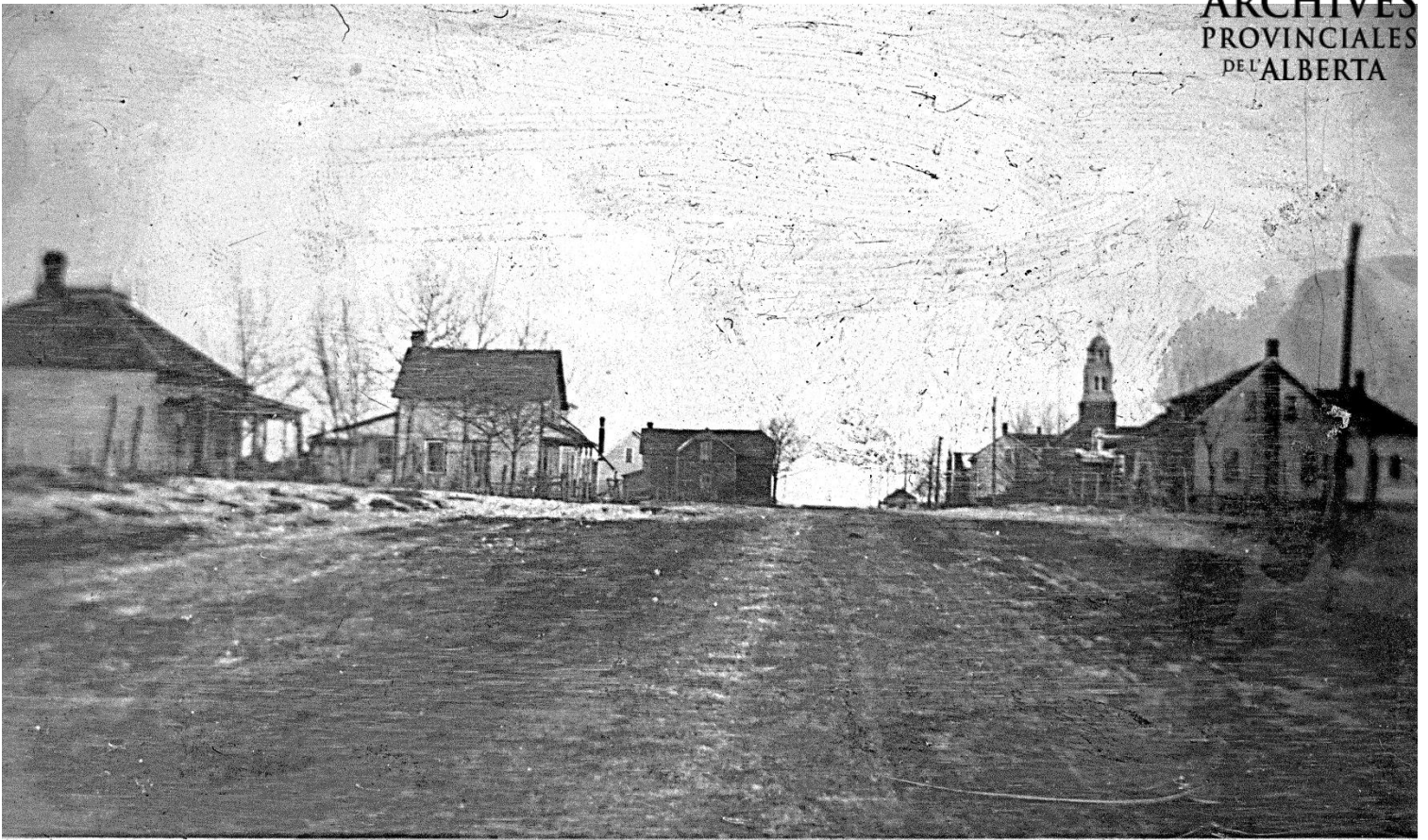
Figure 5 - Rue Principale à Beaumont, après 1920 (APA, A8393)