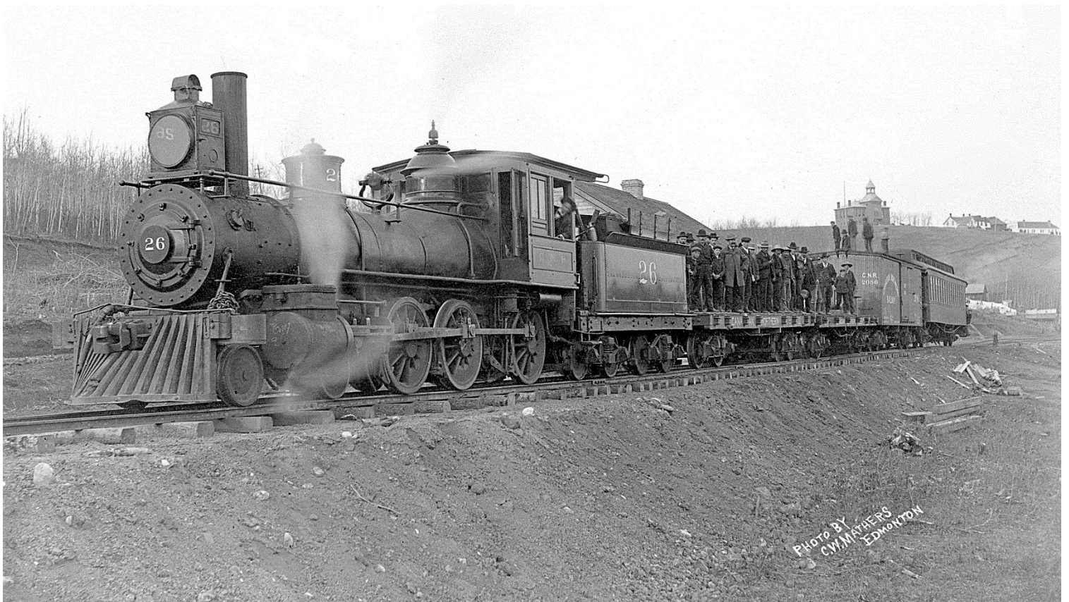
Figure 8 - Premier train à Edmonton, 20 octobre 1902