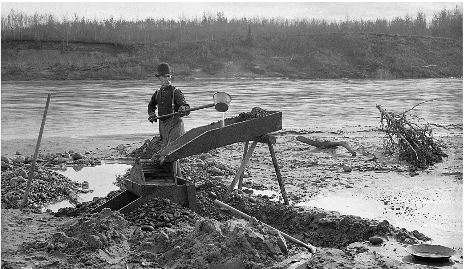
Figure 2 – Chercheur lavant de l'or au bord de la Rivière North Saskatchewan, Edmonton, 1890