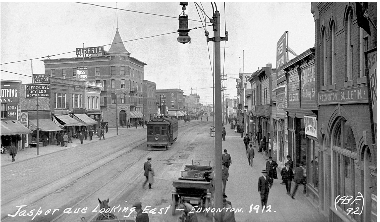
Figure 12 - - Rue Jasper, Edmonton, 1912