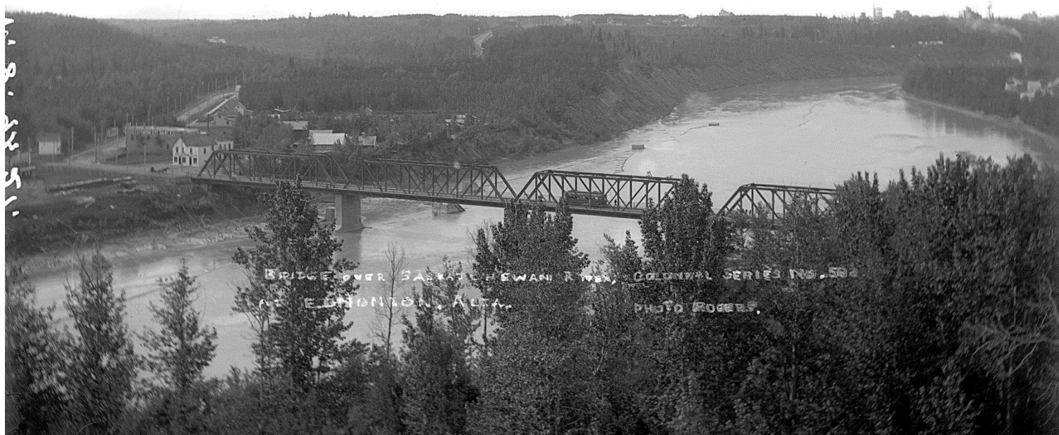
Figure 6 - Edmonton, Low Level Bridge, 1906