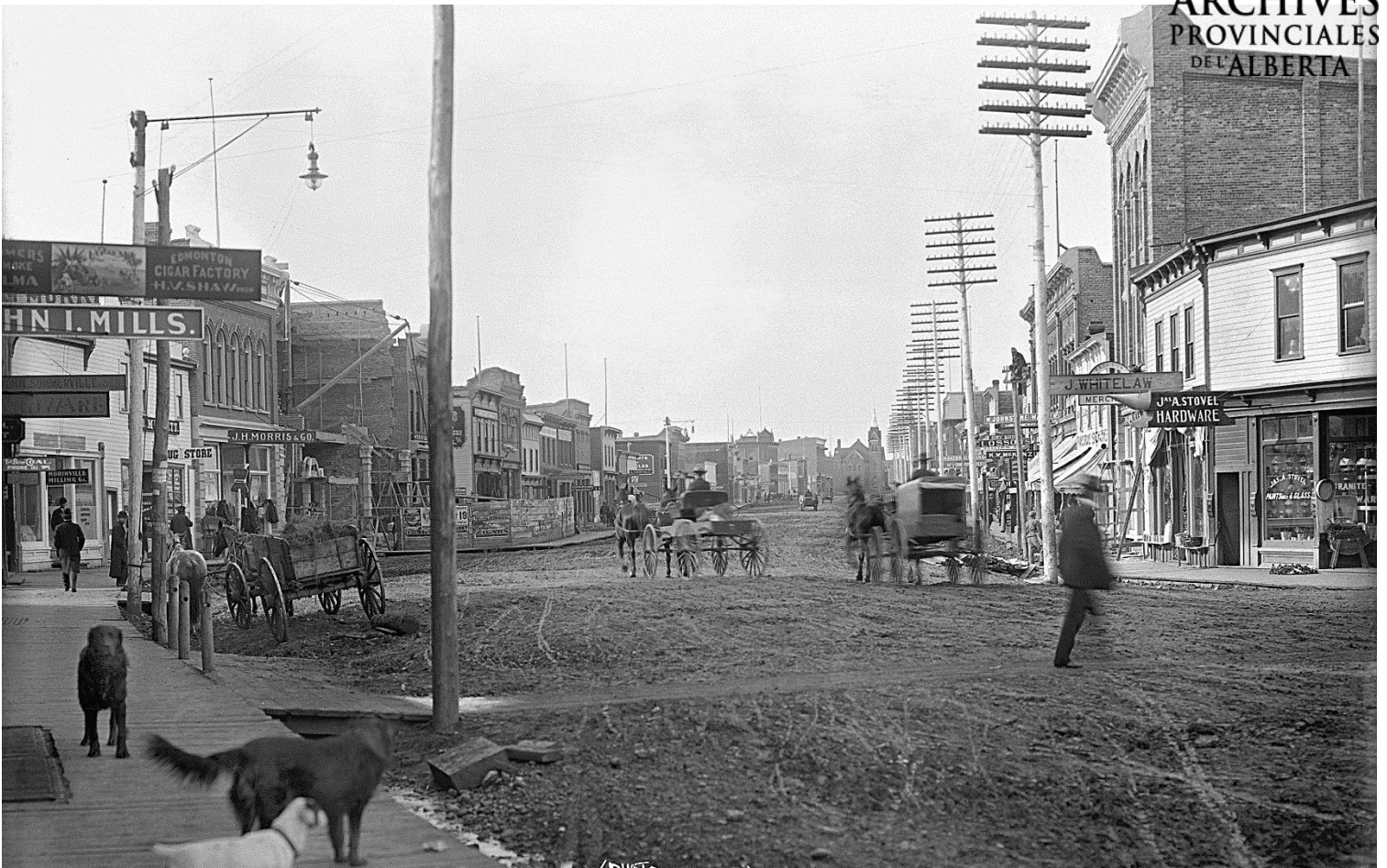
Figure 11 - Rue Jasper, Edmonton, 1903 (APA, B4767)