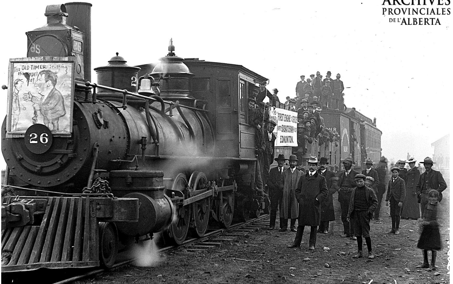
Figure 7 - Premier train à Edmonton, 20 octobre 1902 (APA, B6208)