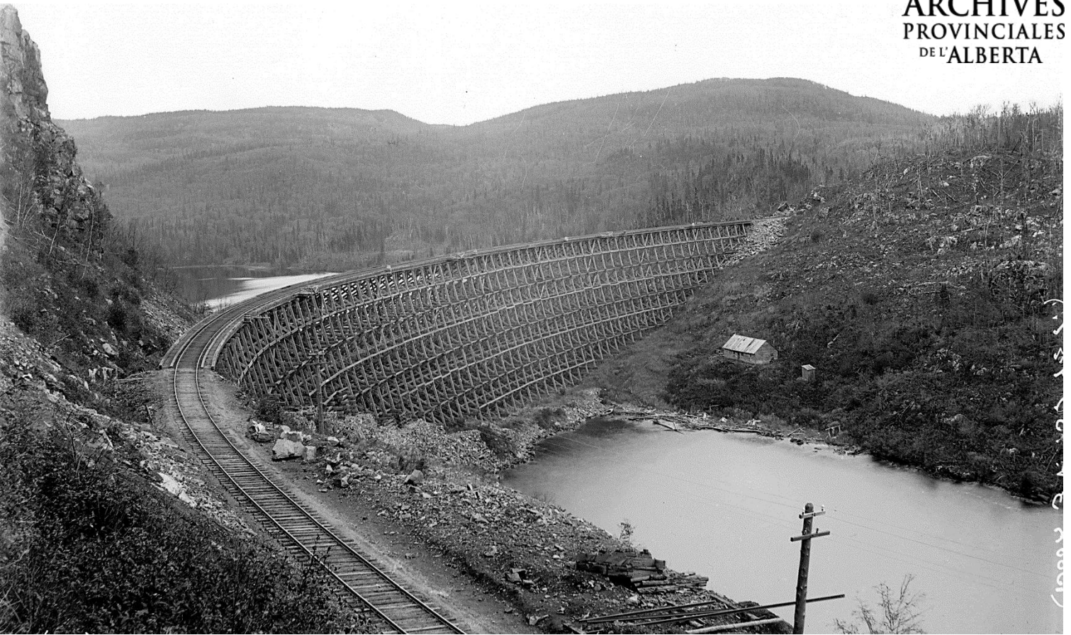
Figure 3 - Pont ferroviaire à chevalets en bois, Red Sucker, Manitoba