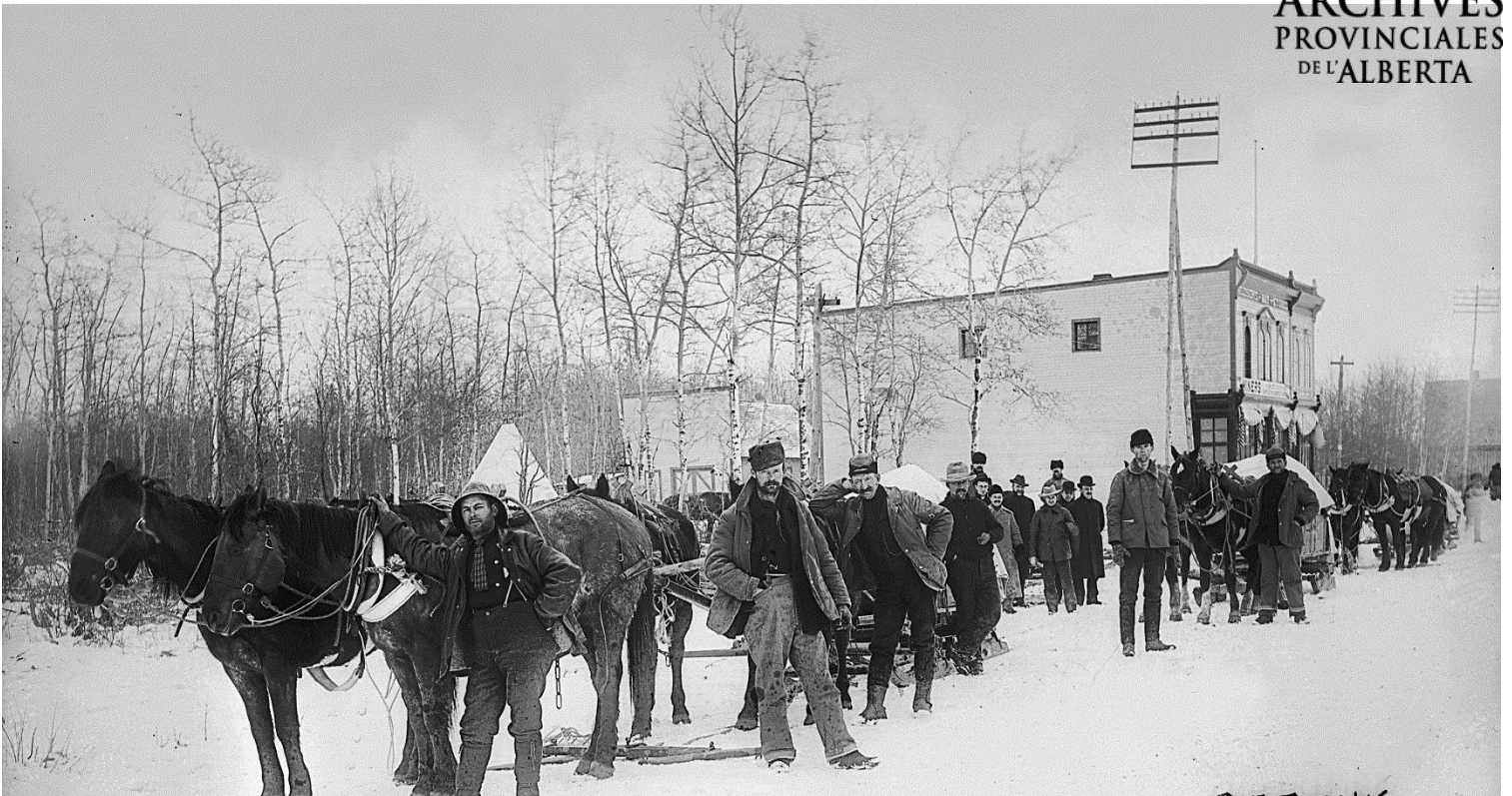
Figure 1 - S'équiper pour Klondike au magasin de la Compagnie de la Baie d'Hudson, 1898 (APA, B5184)