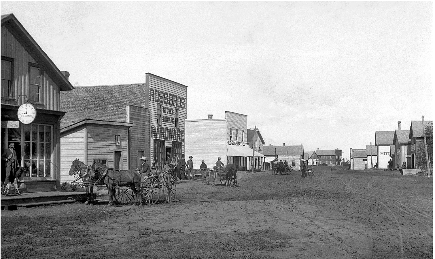
Figure 10 - Rue Jasper, Edmonton, 1890