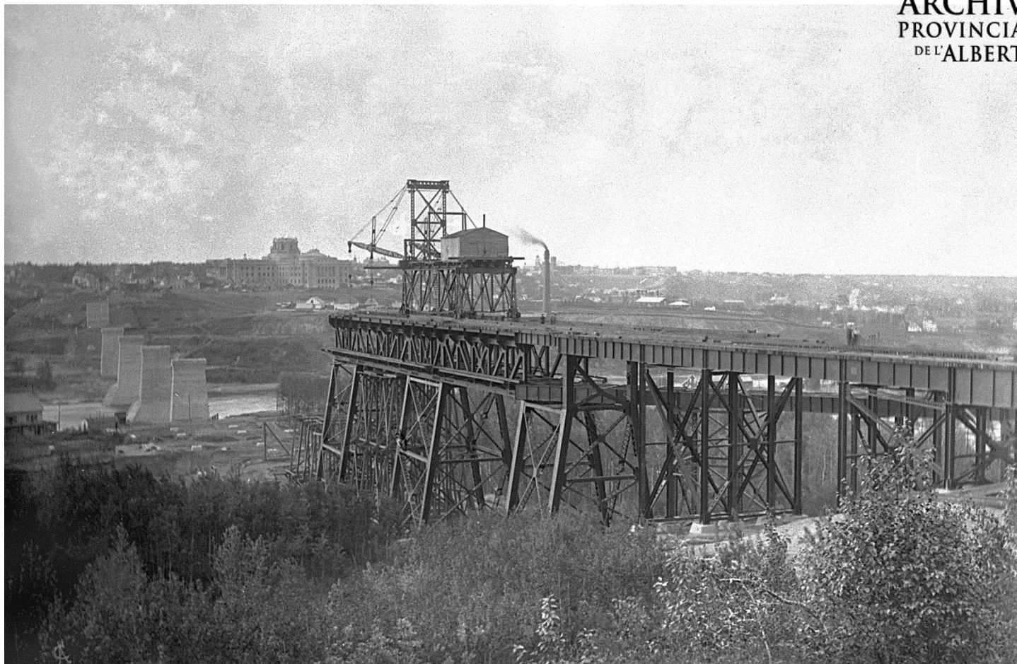
Figure 5 - Construction du pont High Level à Edmonton, 1912 (APA, A2171)