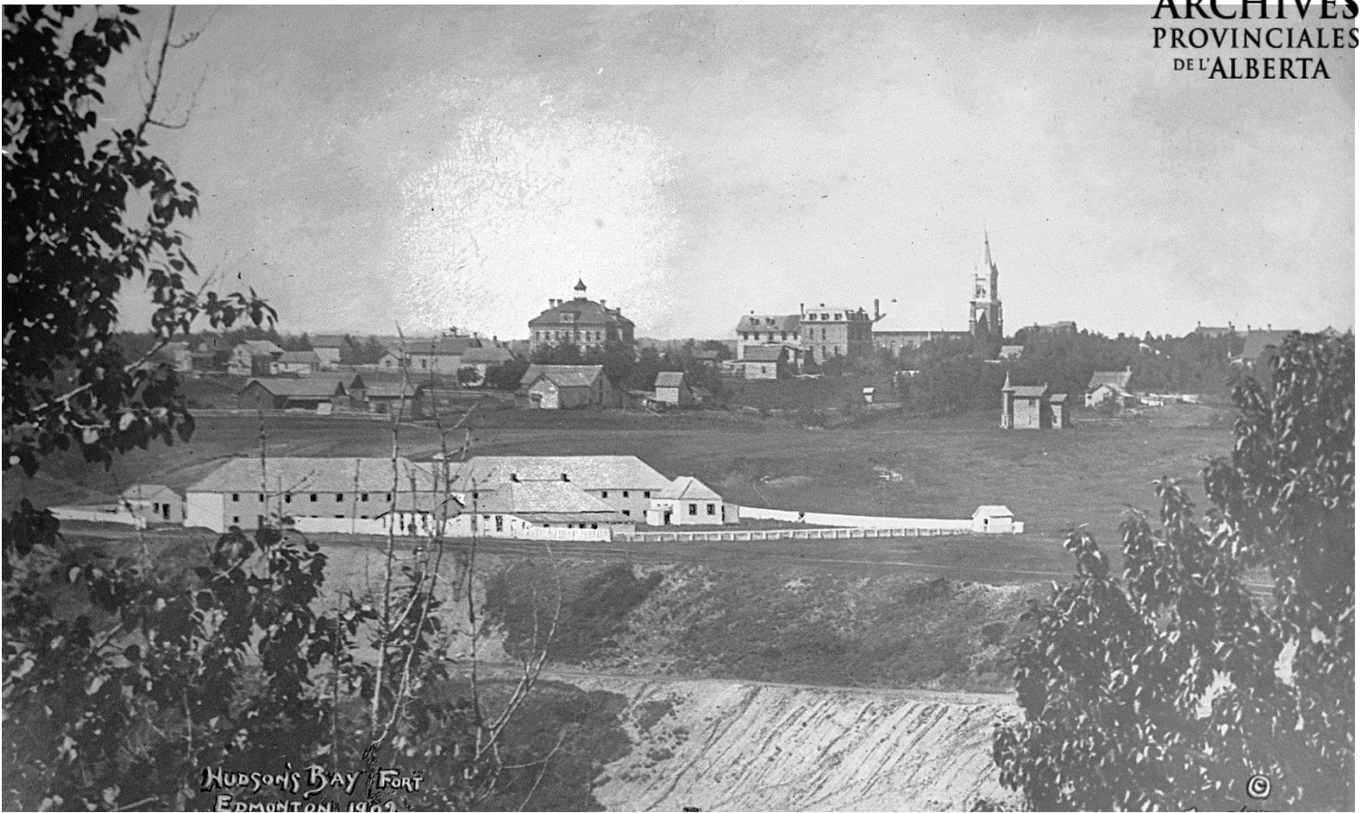
Figure 9 - Vue du vieux Fort Edmonton en 1902 ; église Saint-Joachim au fond