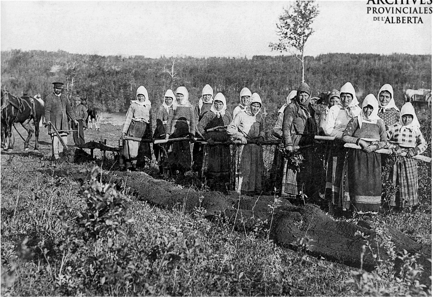
Figure 3 - Femmes doukhobors attelées à une charrue, vers 1900 (APA, P452)