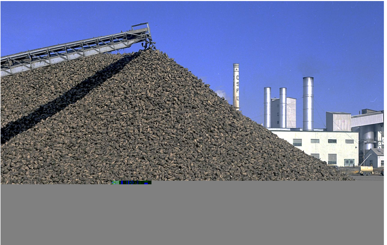
Figure 6 - Usine de sucre de betterave à Taber, Alberta, 1974