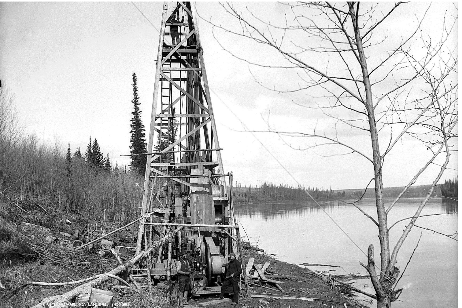
Figure 4 - Puits de pétrole, Athabaska Landing, 1898