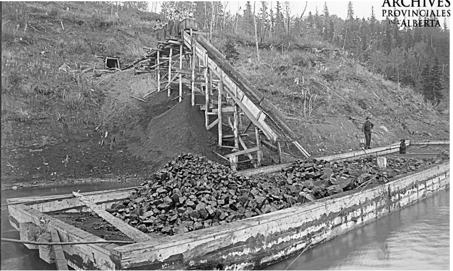
Figure 3 - Extraction de charbon, mine Stewart, Edmonton, les années 1890