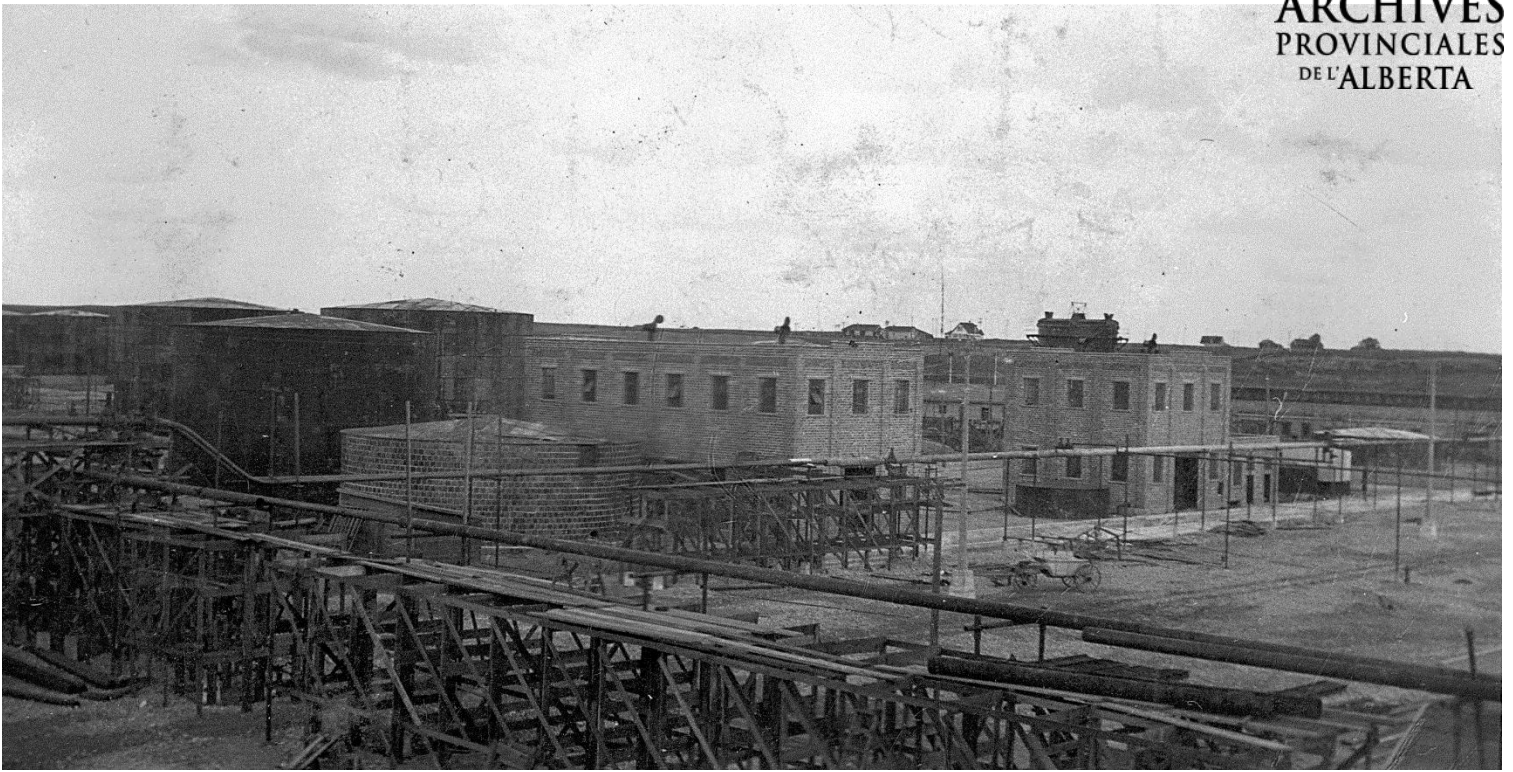
Figure 5 - Raffinerie Imperial Oil à Calgary, 1924